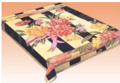
→ NO: 303