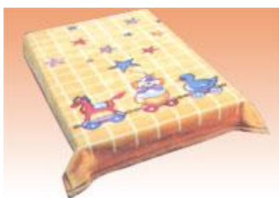
→ NO: 319