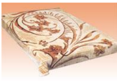
→ NO: 307