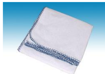
→ NO: 406