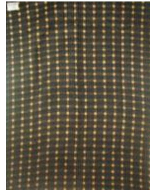
➔ NO: 102