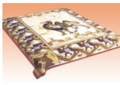
→ NO: 308