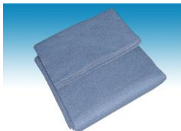
→ NO: 405