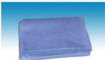
→ NO: 401