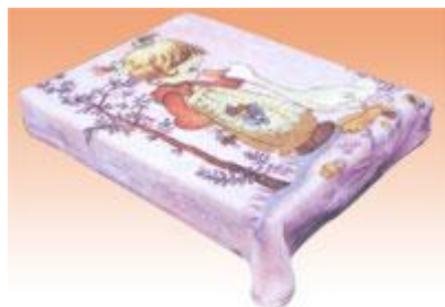
→ NO: 317