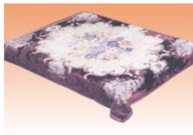
→ NO: 304