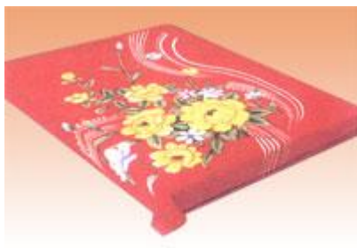
→ NO: 305