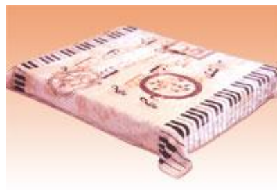
→ NO: 302