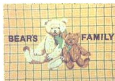
→ NO: 322