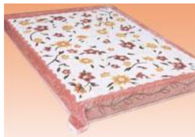
→ NO: 306