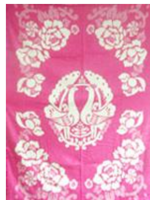
➔ NO: 106