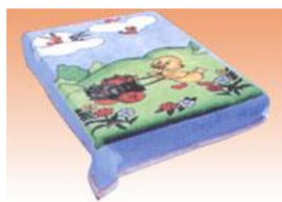
→ NO: 320