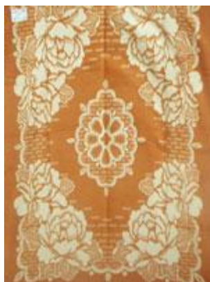
➔ NO: 105