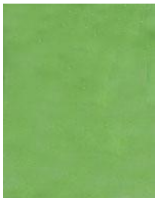
➔ NO: 103