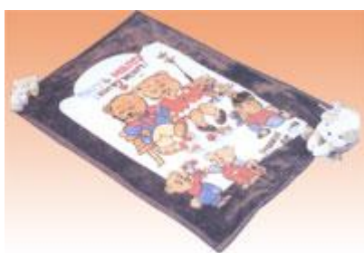
→ NO: 321