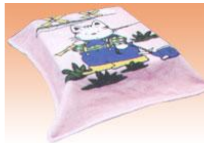
→ NO: 318