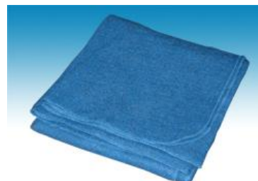
→ NO: 404