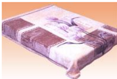
→ NO: 301