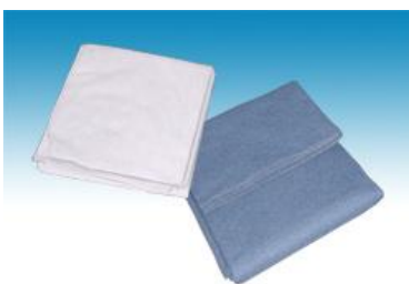
→ NO: 407