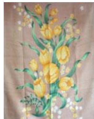
➔ NO: 104