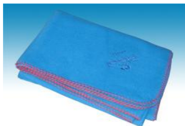
→ NO: 403