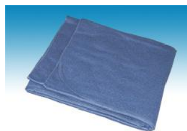
→ NO: 408