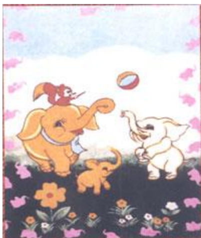
→ NO: 323