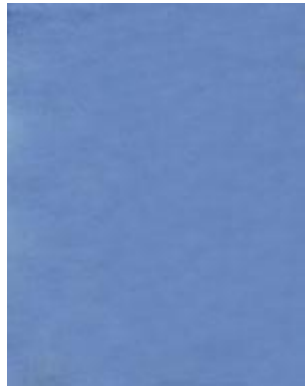
➔ NO: 101

Woven Blended Blanket and Winter Blanket